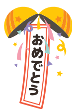
～食と文化のフェスティバル～ 能登島ふれあいまつり